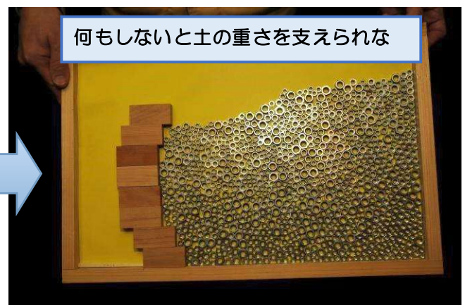
模型を立てた状態その1